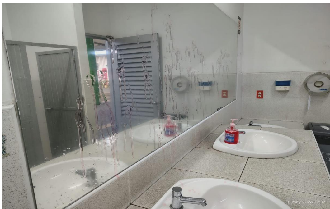
Imagen 2. Baños hombres uso inadecuado jabón líquido de manos.