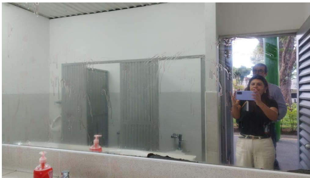
Imagen 3. Baños hombres uso inadecuado jabón líquido de manos.